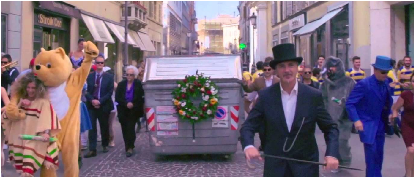
Funeral organitzat per l'últim contenidor de vorera.

Per descomptat, qualsevol canvi en els sistemes de recollida planteja reptes i l'optimització dels procediments requereix temps. A Parma els operaris de la recollida selectiva i la brigada mediambiental s'asseguren que les recollides es facin de manera correcta. Poc després de la introducció del sistema nou, els problemes que van sorgir amb el canvi (com ara el tipus de bossa que calia utilitzar i l'horari de recollida) s'han reduït considerablement. Tot i així, encara hi ha un cert control per part de l'empresa i els operaris que, al mateix temps, donen informació a la ciutadania.