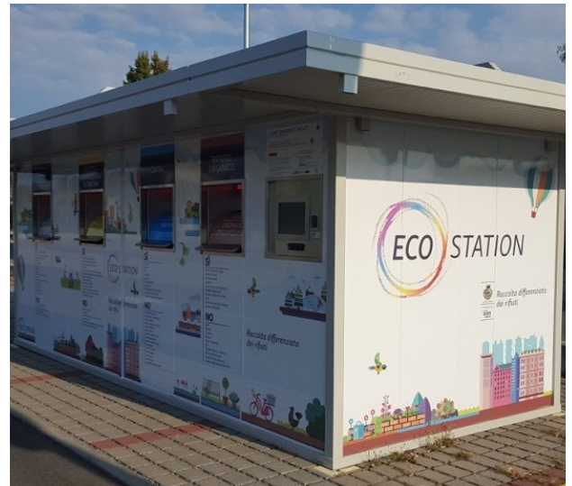
Una Ecoestacion.

El sistema està informatitzat i només s'hi pot accedir amb una targeta d'usuari. Els residus reciclables es recullen gratuïtament, mentre que la fracció resta té un càrrec de 0,7 € per 40 l, la mateixa taxa que s'aplica a la recollida porta a porta i que se suma automàticament al rebut anual. Dins el quiosc hi ha vuit contenidors amb rodes que es buiden cada dia.