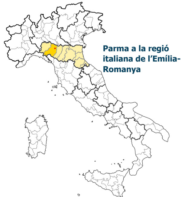
Parma a la regió italiana de l'Emília-Romanya

Malgrat el seu compromís, les obres de construcció de la incineradora ja estaven molt avançades i el cost elevat de la indemnització inclosa al contracte va fer impossible que la ciutat aturés el projecte. Aldo